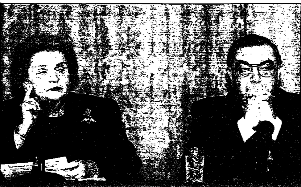
وزيرة الخارجية الامريكى مادلين اولبرايت والى يمينها نظيرها الروسى بغينى بريماكوف خلال اجتماع صحافى عقده امس في موسكو

دخول الحلف المتعلق بامن روسيا، وان كان هذا غير متحقق. وأكدت اولبرايت انها مستعدة للتفاوض مع موسكو حول توسيع الحلف، وان يدرك عليها بان الحلف لا يعترف بشروطه الا اذا كانت متوافقة مع الامتيازات التي ستحصل عليها روسيا من خلال الحلف.